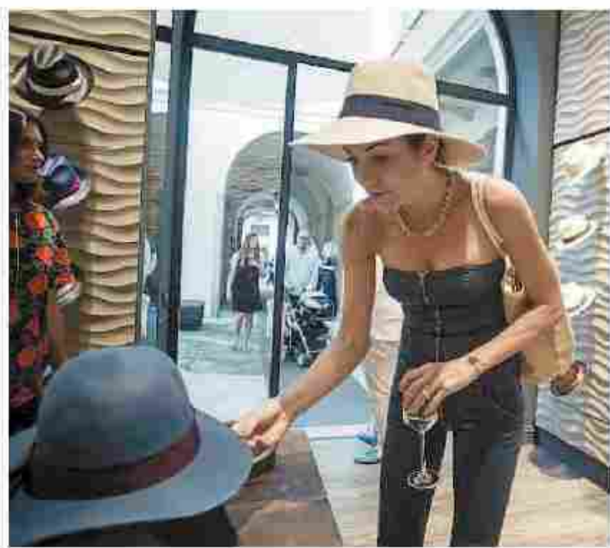
L'interno della boutique Borsalino in Galleria a Milano

L'operazione «made to measure» è partita a giugno e troverà la sua consacrazione sabato con l'inaugurazione ufficiale del «corner» (in realtà un piccolo negozio nel negozio) alla boutique Borsalino, in Galleria a Milano. L'idea è semplice: visto che la personalizzazione capillare tocca un po' tutti i settori del mercato, dalle camicie alle auto, perché non adottarla anche per i cappelli? Così è stato: i clienti si rivolgono al punto vendita milanese, danno le specifiche e in pochi giorni nello stabilimento di Spinetta Marengo, a pochi chilometri da Alessandria, viene realizzato un esemplare uni-