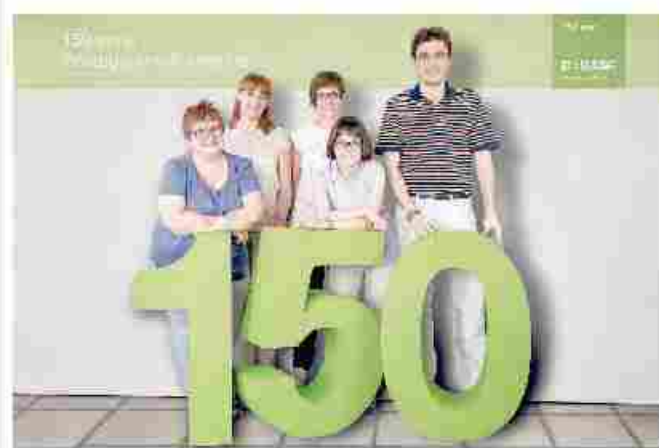
Un gruppo di dipendenti della Basf di Villanova d'Asti

A Londra, in occasione di Designjunction, fiera di interior design contemporaneo (da giovedì a domenica) Serralunga, azienda biellese specializzata in elementi d'arredo in plastica, lancia il concorso: «Caccia Holly All, siediti su di lei e fatti un selfie» Holly All è l'imponente vaso-scultura ideato da Starck.